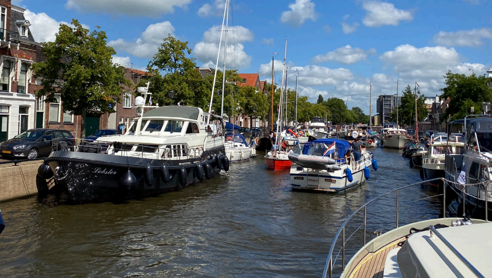
Centre de Sneek