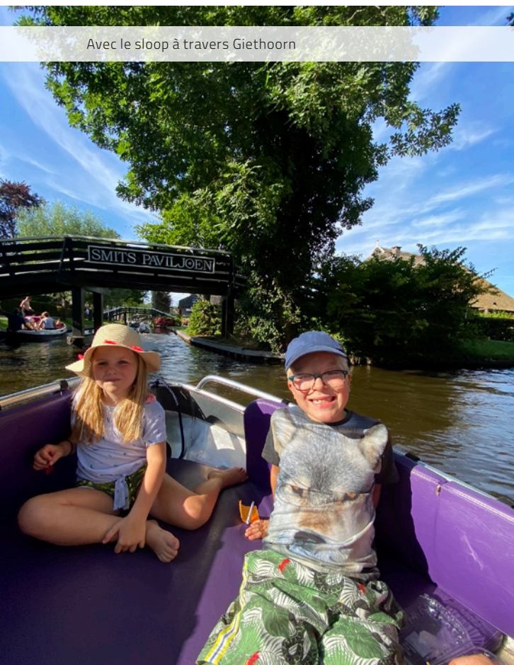
Avec le sloop à travers Giethoorn