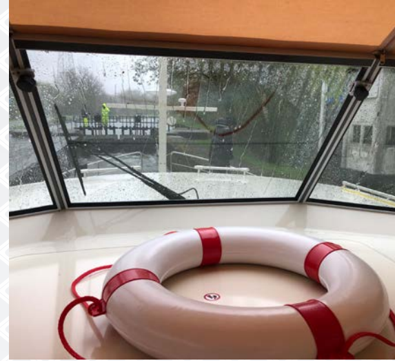
Blaton Ath bij 6 beaufort weer

La première écluse a été rapidement préparée pour nous. Nous pouvions continuer. Tout devait être commandé manuellement, même les ponts qui se trouvaient sur ce trajet. C'était toute