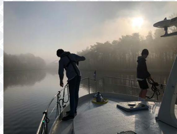
kanal Herentals - Bocholt

Les derniers kilomètres du retour vers le port De Spaanjerd sont passés si vite. Nous avons encore rempli le