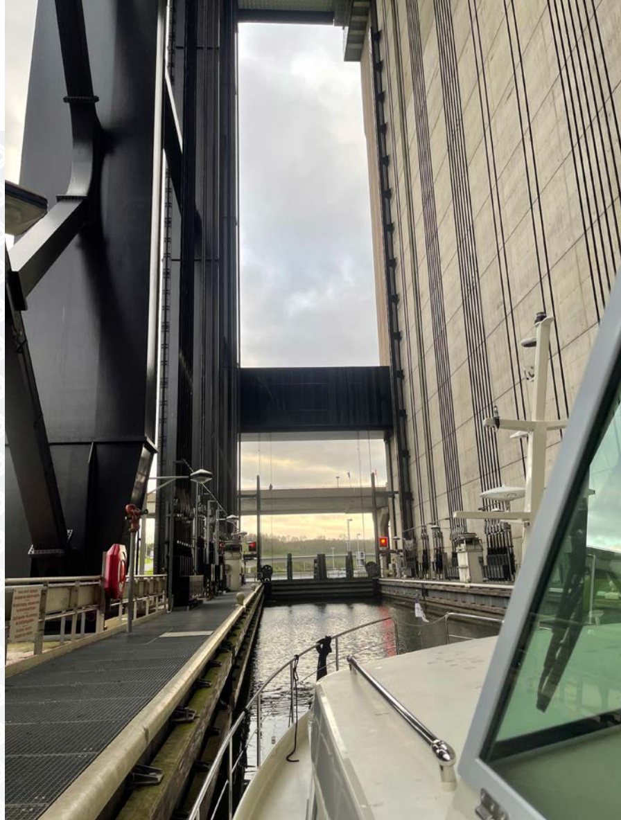
Boatlift Strepv Thieu

Le lendemain s'annonçait comme un grand jour. Si la navigation se déroulait comme prévu, nous devions pouvoir prendre l'ascenseur à bateaux à Strépy-