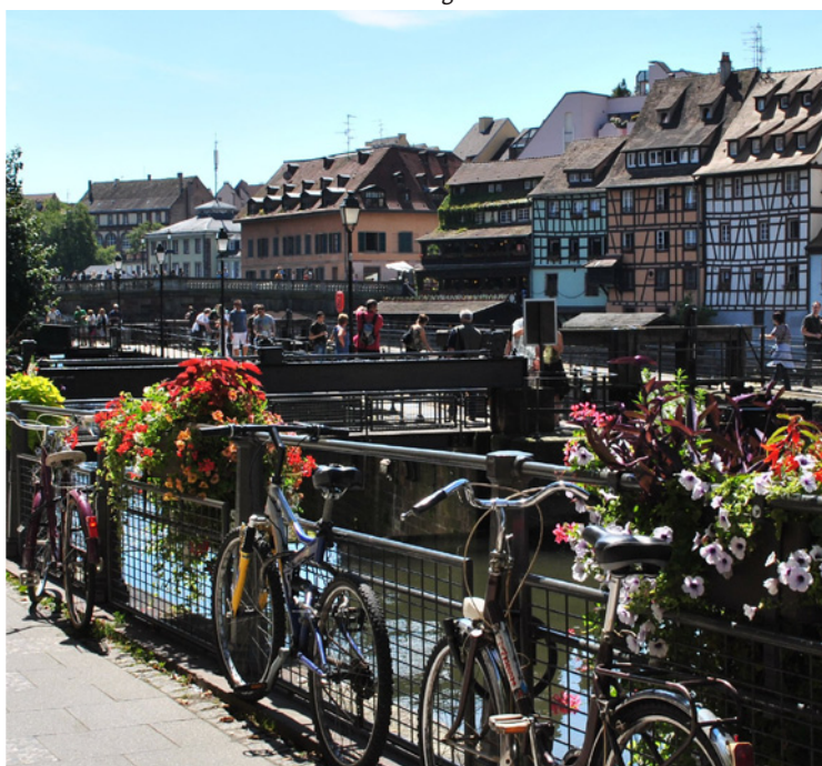
'La Petite France' in Straatsburg

De ontvangst in de relatief grote jachthaven is zeer gastvrij. De door veel bootliefhebbers geprezen havenmeesteres is echter afwezig. Het is immers vakantietijd in Frankrijk, maar dat neemt niet weg dat het juist nu erg druk is in de jachthaven.