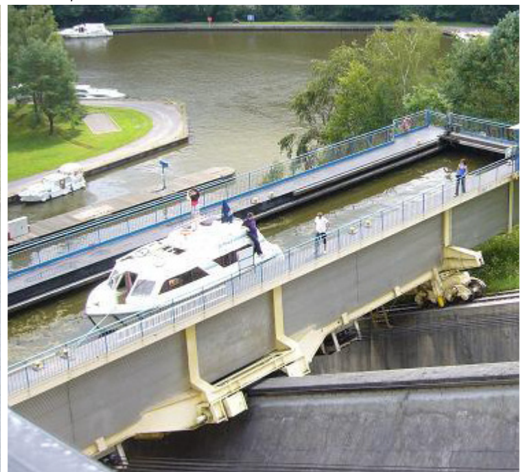
De scheepslift van Arzviller

Kort nadat we de tweede tunnel zijn gepasseerd, dient zich de scheepslift van Arzviller aan. Dit is een toeristische attractie op zichzelf. Vele toeschouwers kijken toe hoe de boten een liftbak invaren die in 20 minuten een hoogteverschil van 44,55 meter overbrugt. Dit technische meesterwerk vervangt in zijn eentje circa 17 sluizen.