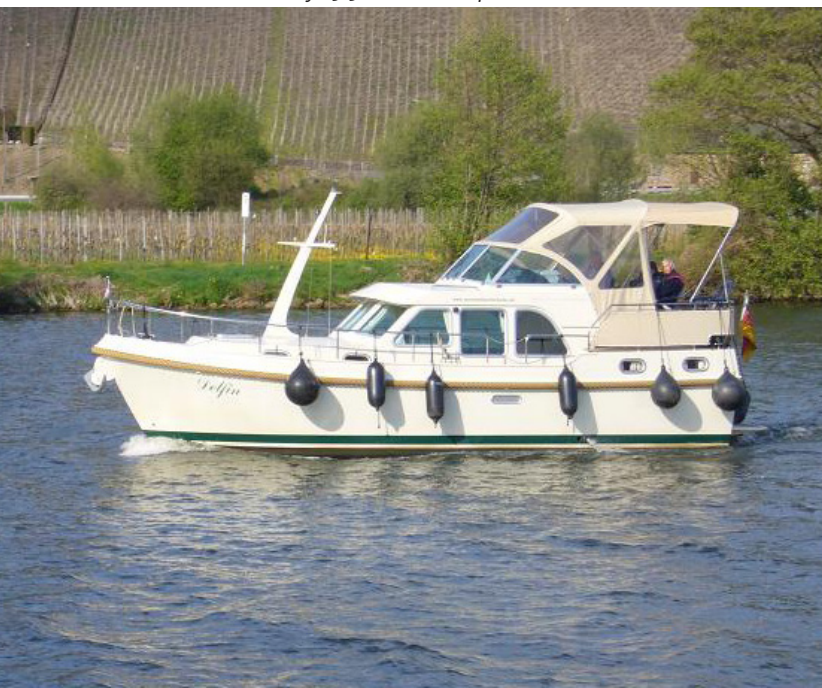
Grand Sturdy 29.9 AC 'Delfin' op de Moezel

Negen sluizen verder leggen we aan in Einville-au-Jard. De sluizen hier zijn wat lastiger te passeren omdat zich vaak vervelende stromingen voordoen. De volgende ochtend benutten we in Lagarde de eerste tankmogelijkheid. Sinds Schwebsange in Luxemburg hebben we 134 liter brandstof verbruikt, oftewel 1,8 liter per uur. Dit is bepaald niet veel te noemen voor ons trouwe jacht met een motor van 55 pk, die geruisloos zijn dienst doet. Bij een sluis verkoopt een vriendelijke, oude man vers geplukte mirabellen – wederom heerlijk!