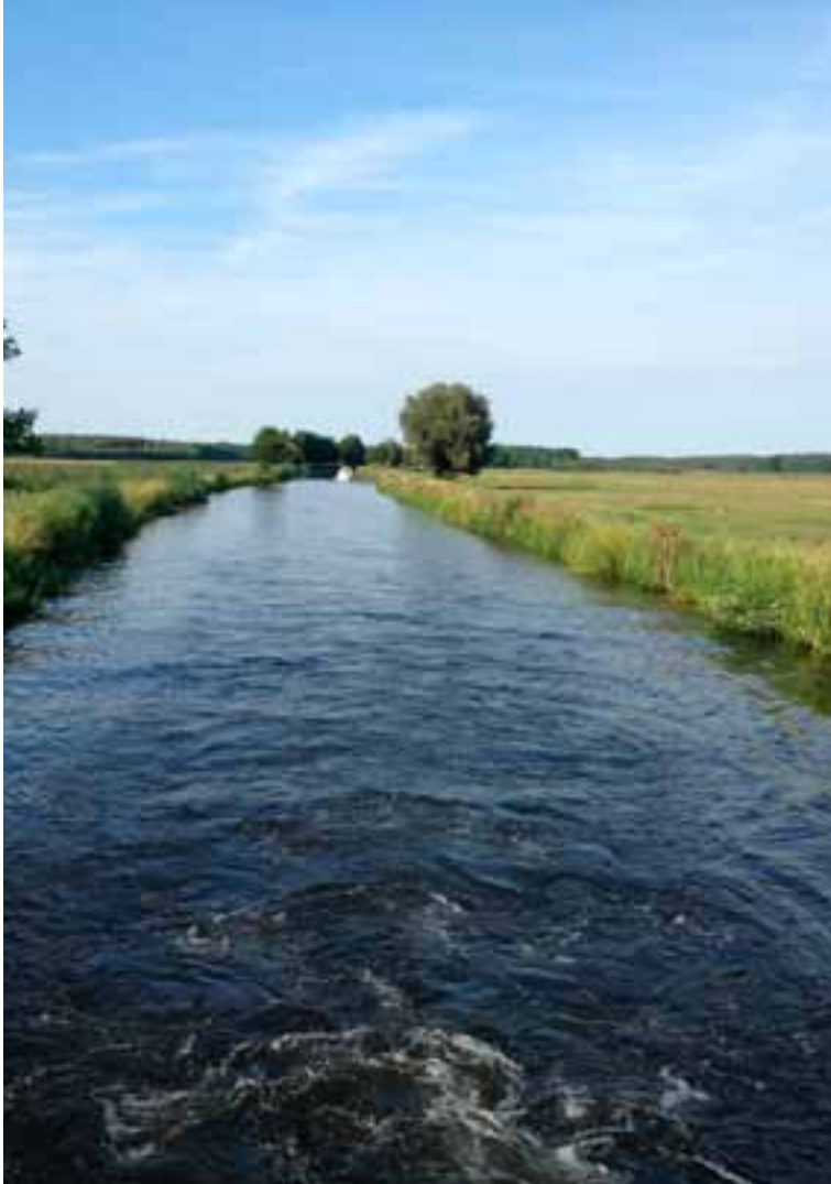
Muritz-Elde-Wasserstrasse – voorbij Bobzin wordt het smaller en ondieper