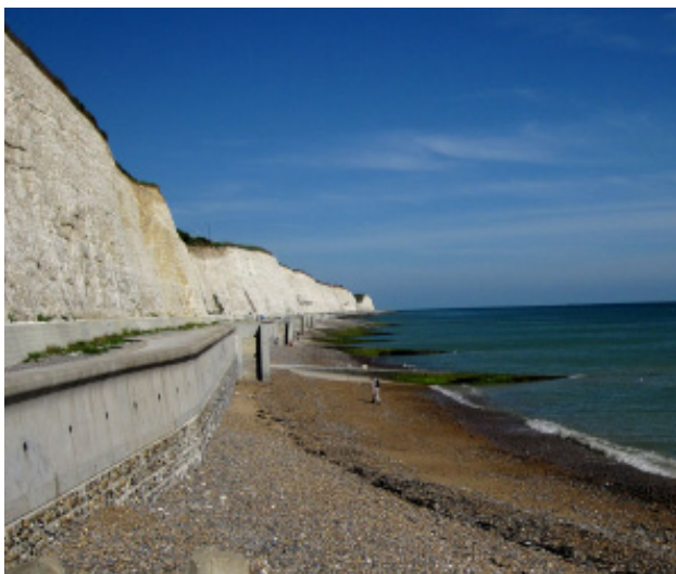
Kreidefelsen bei Brighton

du da nicht rein.“ Die Ehepaare sind begeistert von den Segelwettbewerben, die dort stattfinden. Ganz im englischen Stil mit klassischen Booten und Mannschaften in Blazern und Shorts. “Alle dort, Jung und Alt, sind geradezu wassersportverrückt. Es war toll, den verschiedenen Booten mit begeisterten Wettkampfsiegeln zuzuschauen.”