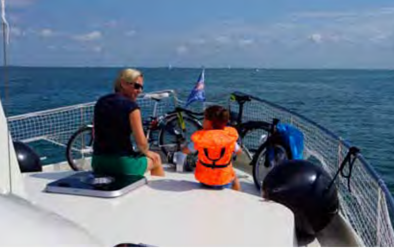
Ein Netz an der Reling bedeutet für die Jüngsten an Bord mehr Sicherheit.